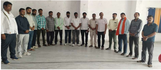
अवैधकर भवन में पदभार ग्रहण कार्यक्रम आयोजित, संगठन को मजबूत करने का लिया संकल्प