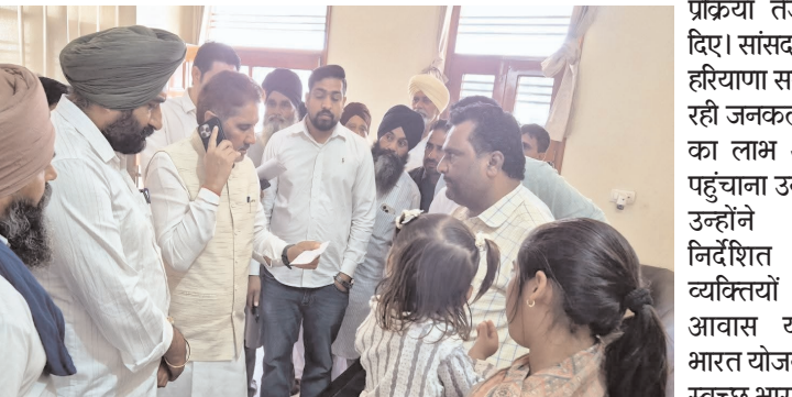
प्रार्थी की बात ध्यानपूर्वक सुनते हुए कई मामलों में मौके पर ही संबंधित अधिकारियों से समाधान की