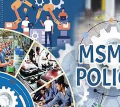
जांच और स्वीकृति के लिए जिला स्तरीय टास्क फोर्स समिति कार्य करती थी, लेकिन अब इसको विलोपित कर दिया गया है। उससे जुड़े सभी अधिकार महाप्रबंधकों को दे दिए गए हैं। इसलिए अब एक निश्चित समयान्तराल पर होने वाली बैठक का इंतजार किए बिना ही सामान्य प्रक्रिया के तहत आवेदनों पर एक्शन लिया जा सकेगा। बजट पर चर्चा के दौरान ऐसी घोषणा की गई थी। उद्योग एवं वाणिज्य विभाग ने इसकी अधिसूचना जारी कर दी है।

जयपुर । राज्य सरकार की एक जिला एक उत्पाद नीति-2024 और राजस्थान एमएसएमई नीति -2024 के तहत स्वीकृति प्रक्रिया में बड़ा बदलाव किया गया है। अब इन दोनों योजनाओं के तहत आने वाले आवेदनों की जांच और स्वीकृति जिला उद्योग एवं वाणिज्य केंद्रों के जीएम ही कर सकेंगे। इस बदलाव से आवेदन के निस्तारण में तेजी आएगी, जिससे ज्यादा लोगों को लाभ मिल सकेगा। पूर्व में इन योजनाओं के तहत आने वाले आवेदनों की