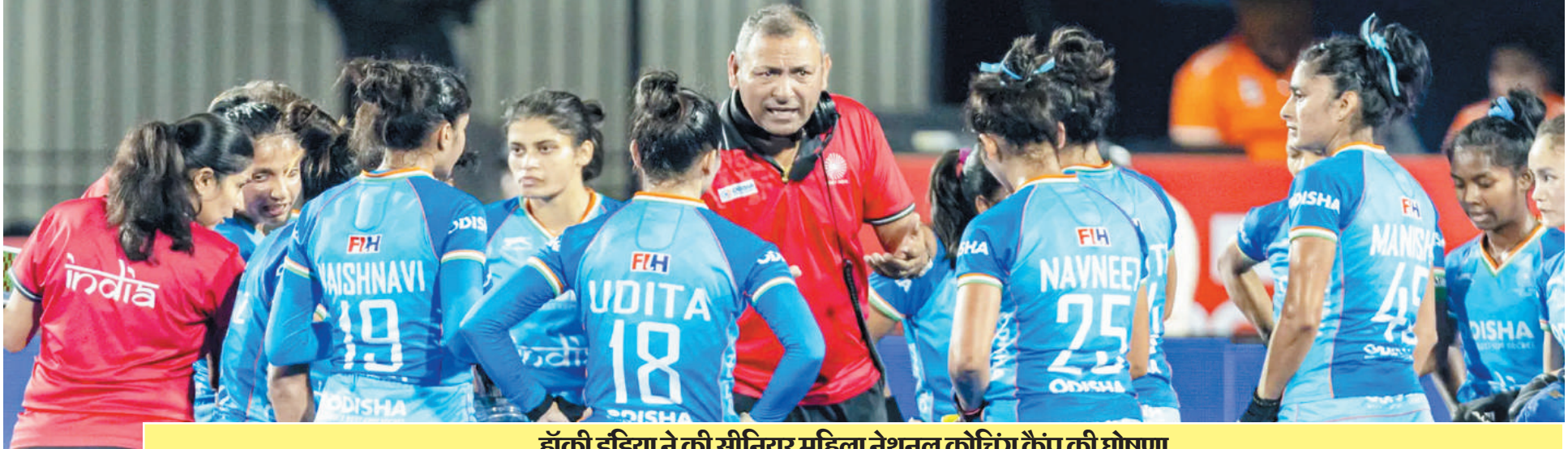
हॉकी इंडिया ने की सीनियर महिला नेशनल कोचिंग कैंप की घोषणा

'धुरंधर 2' बॉक्स ऑफिस पर जमकर कमाई कर रही है, इस फिल्म की सफलता में अर्जुन रामपाल का भी हाथ है। फिल्म में उन्होंने मेजर इकबाल का खूंखार रोल किया है। अर्जुन रामपाल के अभिनय को खूब सराहा गया। इस फिल्म की सफलता के बीच अर्जुन रामपाल के पास कई नए प्रोजेक्ट्स भी आ रहे हैं। जल्द ही वह 'बिलेनियर' नाम की सीरीज में नजर