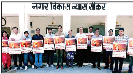
शोध और लेखन में भी सक्रिय