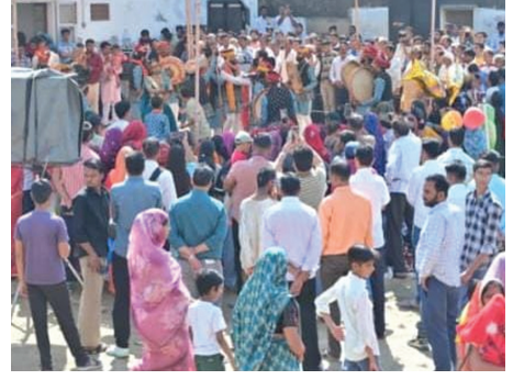
तथा आंगतुकों का आभार व्यक्त किया।