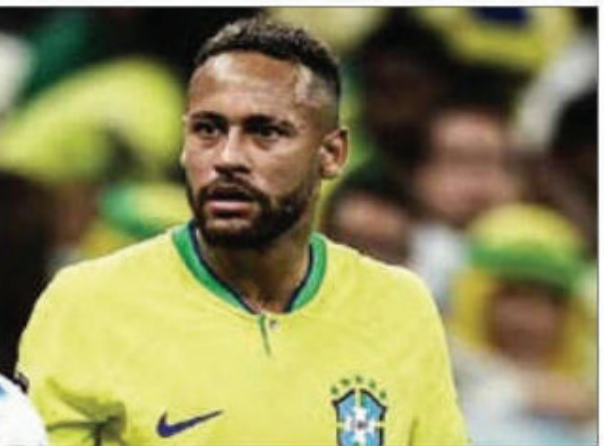
तक बाहर रहे। एंसेलोटी ने कहा है कि वह अपनी वर्ल्ड कप टीम चुनते समय सिर्फ उन खिलाड़ियों पर विचार करेंगे जो अपने क्लब के लिए रेगुलर खेल रहे हैं।

कहा कि उन्हें अपने करीबी लोगों ने निराश किया है, लेकिन उन्होंने ज्यादा जानकारी नहीं दी। उन्होंने कहा, 'मुझे सबसे ज्यादा हैरानी उन लोगों से होती है, असल में, यह मुझे हैरान नहीं करता, जो हर दिन मेरे साथ रहते हैं और कहानियां बनाना शुरू कर देते हैं, यह-वह कहते हैं जैसे कि यह बिल्कुल सच हो, जैसे कि वे ही सब कुछ जानते हों। मेरे लिए यह बहुत मुश्किल है, है भगवान। आप सभी को खेलने के लिए मुझे बहुत सब्र रखना होगा।' दिसंबर में अपने बाएं घुटने की आर्थोस्कोपिक सर्जरी के बाद नेमार इस साल सैंटोस के लिए सिर्फ तीन मैच खेलें हैं। अक्टूबर 2023 में उरुग्वे के खिलाफ वर्ल्ड कप क्वालिफायर में एंटीरियर क्रूसिएट लिगामेंट फटने के बाद से वह ब्राजील के लिए नहीं खेलें हैं, इस चोट की वजह से वह एक साल से ज्यादा समय