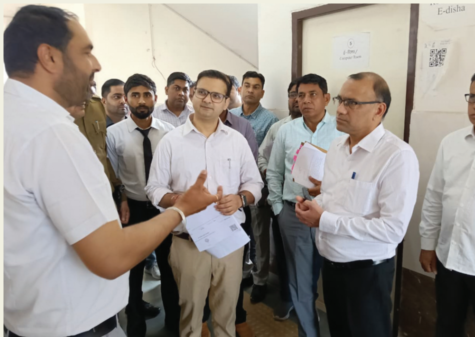
व्यवस्थाओं का भी अवलोकन किया और साफ-सफाई सहित मूलभूत सुविधाओं को बेहतर बनाए रखने के निर्देश दिए।

रजत विजय रंगा। डीसी डॉ. विवेक भारती ने बुधवार को कुलां, जाखल उप तहसील व बीडीपीओ कार्यालय का निरीक्षण कर विभिन्न कार्यालयों की कार्यप्रणाली का जायजा लिया। इस दौरान उन्होंने राजस्व विभाग के अधिकारियों व कर्मचारियों को स्पष्ट निर्देश दिए कि राजस्व विभाग से जुड़े कार्यों को प्राथमिकता के आधार पर समयबद्ध तरीके से पूरा किया जाए ताकि आमजन को किसी प्रकार की असुविधा का सामना न करना पड़े। उन्होंने कहा कि व्यवस्थित व पारदर्शिता के साथ आमजन को राजस्व सेवाएं मुहैया कराना विभाग का दायित्व है जिसे बखूबी निभाया जाए। कुलां उप तहसील के निरीक्षण के दौरान डीसी डॉ. विवेक भारती ने पेपरलेस रजिस्ट्रेशन हेल्थ डेस्क, राजस्व कोर्ट तथा ई-दिशा केंद्र का निरीक्षण कर वहां उपलब्ध सेवाओं की समीक्षा की। उन्होंने अधिकारियों को निर्देश दिए कि पेंडिंग म्यूटेशन, इतकाल और ग़रदावरी के मामलों को बिना विलंब ऑनलाइन किया जाए और प्रत्येक प्रकरण का समय पर निपटान सुनिश्चित किया जाए। निरीक्षण के दौरान डीसी ने कार्यालय परिसर की