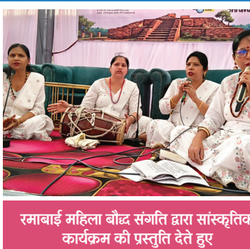
रमाबाई महिला बौद्ध संगति द्वारा सांस्कृतिक कार्यक्रम की प्रस्तुति देते हुए