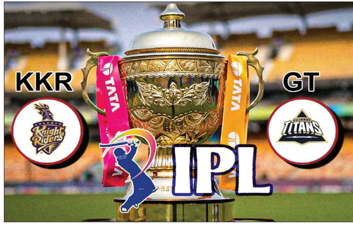
सिराज के अलावा स्पिनर राशिद खान संभालेंगे।

आंकड़ों पर नजर डालें तो अब तक दोनों ही टीमों के बीच 6 मुकाबले हुए हैं जिसमें से केकेआर ने 1 जबकि गुजरात ने 4 जीते हैं, वहीं एक मैच का परिणाम नहीं आया है। इस मैच में केकेआर को अगर जीतना है तो उसे अपना सर्वश्रेष्ठ प्रदर्शन करना होगा। केकेआर की बल्लेबाजी कप्तान अजिंक्य रहाणे के अलावा अंगकृष रघुवंशी, कैमरून ग्रीन और रिंकू सिंह पर आधारित रहेगी। वहीं गेंदबाजी कार्तिक त्यागी, वैभव अरोड़ा के अलावा रहस्यमयी स्पिनर सुनील नरेन पर आधारित रहेगी दूसरी ओर इस सत्र में शुभमन गिल की कप्तानी में शानदार प्रदर्शन कर रही गुजरात की बल्लेबाजी शुभमन के अलावा साई सुदर्शन और राहुल तेवतिया पर आधारित रहेगी। टीम की गेंदबाजी की कप्तान कगिसो रबाडा, मोहम्मद