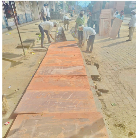
कमजोर गैन्सा पट्टियों से नाले का पटाव करते हुये

मनोज खंडेलवाल। नगरपालिका मंडावर की ओर से नए बस स्टैंड क्षेत्र में खुले नालों को ढकने के लिए करीब 24.99 लाख रुपए की लागत से कराए जा रहे पटाव कार्य पर अब गंभीर सवाल खड़े होने लगे हैं। जिस कार्य को आमजन की सुरक्षा और राहत का माध्यम माना जा रहा था, वही अब लोगों की नजर में संभावित हादसे का कारण बनता दिखाई दे रहा है। स्थानीय नागरिकों, व्यापारियों और सामाजिक लोगों ने आरोप लगाया है कि नालों को मजबूत फेरोकवर से ढकने के बजाय कमजोर और निम्न गुणवत्ता वाले पत्थर लगाकर निर्माण कार्य को केवल खानापूर्ति में बदला जा रहा है। 'ऊपर से बिकास, भीतर से विनाश' जैसी चर्चाएं अब शहर की गलियों से लेकर सोशल मीडिया तक खुलकर सुनाई देने लगी हैं। लोगों का कहना है कि नालों पर लगाए जा रहे पत्थर स्थानीय भाषा में 'गैन्सा' कहलाते हैं, जिन्हें भार सने के लिहाज से कमजोर माना जाता है। नागरिकों ने आशंका जताई कि यदि इन पत्थरों पर कोई बच्चा, बुजुर्ग, राहगीर या मवेशी चढ़ जाए तो किसी भी समय पत्थर टूट सकता है और व्यक्ति सीधे गहरे नाले में गिरकर गंभीर घायल हो सकता है। शहरवासियों का कहना है कि बरसात के मौसम में पहले ही खुले नाले दुर्घटनाओं का कारण बने हुए हैं, ऐसे में कमजोर सामग्रियों का उपयोग करना सीधे तौर पर आमजन की जान जोखिम में डालने जैसा है। लोगों में यह सवाल भी गूँज रहा है कि आखिर जब