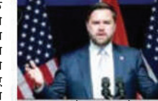
खत्म हो जाती है, तो अंतिम फैसला राष्ट्रपति का होगा।' अमेरिका लंबे समय से ईरान के परमाणु कार्यक्रम को लेकर चिंतित है। ट्रंप प्रशासन चाहता है कि ईरान अपनी परमाणु गतिविधियों पर कड़ी रोक लगाए। वहीं ईरान अपने अधिकारों और सुरक्षा चिंताओं का हवाला देता रहा है। ईरान और अमेरिका के बीच परमाणु कार्यक्रम को लेकर जिनेवा में बातचीत का दूसरा दौर खत्म हो गया है। ईरान की सरकारी मीडिया के मुताबिक, यह बैठक लगभग तीन घंटे तक चली, जिसमें कोई नतीजा नहीं निकला है। मंगलवार को हुई यह मुलाकात परमाणु मुद्दे पर दोनों देशों के बीच दूसरे दौर की बातचीत थी। जिनेवा में वार्ता व अन्धकार ऐसे समय हुए जब अमेरिका ने पश्चिम एशिया में अपनी सैन्य उपस्थिति बढ़ा दी है।

जिनेवा, एजेंसी। अमेरिका और ईरान के बीच चल रही कूटनीतिक बातचीत को लेकर ताजा बयान सामने आया है। अमेरिका के उपराष्ट्रपति जेडी वेंस ने कहा है कि ईरान अभी तक राष्ट्रपति डोनाल्ड ट्रंप की तरफ से तय की गई मुख्य शर्तों को मानने के लिए तैयार नहीं है। अमेरिकी उपराष्ट्रपति जेडी वेंस ने बताया कि जिनेवा में हुई बातचीत 'कुछ मायनों में ठीक रही', क्योंकि दोनों देशों ने आगे भी बैठक जारी रखने पर सहमति जताई है। लेकिन उन्होंने साफ कहा कि ईरान ने अब तक ट्रंप की प्रमुख शर्तों को स्वीकार नहीं किया है। उनके मुताबिक- राष्ट्रपति ट्रंप ने कूटनीतिक समाधान के लिए कुछ स्पष्ट शर्तें रखी हैं। इन शर्तों में सबसे बड़ा मुद्दा ईरान का परमाणु कार्यक्रम है। ईरान अभी इन शर्तों पर खुलकर सहमति देने को तैयार नहीं दिख रहा। जेडी वेंस ने कहा कि अमेरिका अभी भी बातचीत के जरिए समाधान चाहता है। लेकिन उन्होंने चेतावनी भी दी कि अगर बातचीत बेनतीजा रही, तो आगे क्या करना है- इसका फैसला राष्ट्रपति ट्रंप करेंगे। उनका कहना था, 'हम चाहते हैं कि मामला बातचीत से सुलझे, लेकिन अगर कूटनीति की सीमा