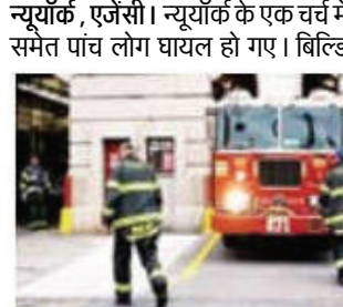
न्यूयॉर्क, एजेंसी। न्यूयॉर्क के एक चर्च में एक जोरदार धमाका हुआ जिसमें एक फायरफाइटर समेत पांच लोग घायल हो गए। बिल्डिंग में गैस की गंध की रिपोर्ट मिली थी जिसके बाद अग्निशमन विभाग यहां आया था। न्यूयॉर्क स्टेट पुलिस धमाके के कारण की जांच कर रही थी, जो सिरियक्यु से लगभग 50 मील (80 किलोमीटर) उत्तर-पूर्व में एक ग्रामीण इलाके में एडवेंट लाइफ फेलोशिप चर्च में सुबह करीब 10:30 बजे हुआ। पांच लोगों को इलाज के लिए लोकल हॉस्पिटल ले जाया गया। दो की हालत गंभीर बताई गई, जिसमें एक फायरफाइटर भी शामिल है जो मौके पर पहुंचा था। पुलिस ने बताया कि बाकी तीन लोगों की चोटों का इलाज किया जा रहा है। पुलिस ने कहा कि धमाके से जुड़ी कोई किमिनल एक्टिविटी का शुरुआती संकेत नहीं मिला, जिससे हवा में काले धुएँ का घना गुबार फैल गया और चर्च को बहुत नुकसान हुआ। स्टेट टूपर्स के अनुसार, चर्च को प्रोपेन सिलेंडर से गर्म किया जाता था।