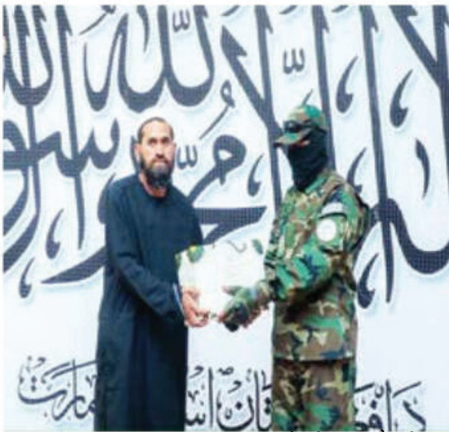
बीच रिश्तों की डोर बेहद कमजोर हो चुकी है।

रिहाई का कारण: उन्होंने कहा कि सैनिकों को रिहा करने का निर्णय रमजान की शुरुआत को देखते हुए लिया गया है, जो इस्लाम में उपवास और आत्म-चिंतन का पवित्र महीना माना जाता है। अफगानिस्तान और उसके पड़ोसी पाकिस्तान के बीच पिछले साल अक्टूबर से ही तनाव काफ़ी बढ़ा हुआ है। दोनों देशों के बीच तनाव की कहानी अफगानिस्तान और पाकिस्तान के बीच वर्तमान में जो तलखी दिखाई दे रही है, उसकी जड़ों पिछले साल अक्टूबर की घटनाओं में छिपी हैं। भले ही अब 3 सैनिकों की रिहाई को एक सकारात्मक कदम माना जा रहा है, लेकिन दोनों पड़ोसियों के