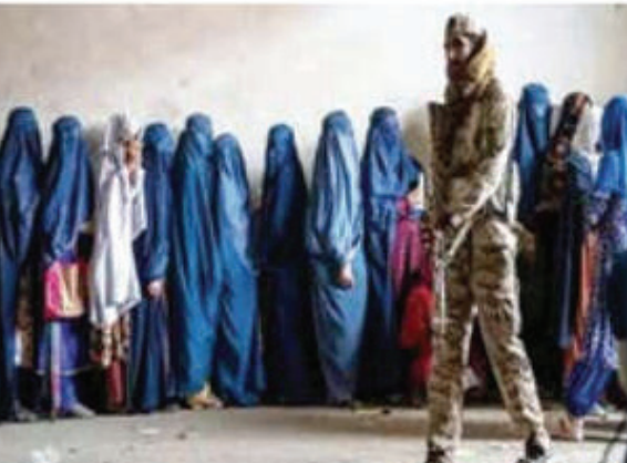
'आजाद' है या 'गुलाम'। इस व्यवस्था में समाज को ऊंचे और निचले दर्जों में बांटने की बात कही गई है। ऊपरी श्रेणी में धार्मिक नेता और मुल्ला शामिल होंगे, जबकि निचली श्रेणी के लोगों पर शारीरिक दंड को अधिक स्वीकार्य माना गया है। इसमें महिलाओं को व्यवहारिक रूप से 'गुलाम' की श्रेणी में रखा गया है और पति को 'स्वामी' का दर्जा दिया गया है। नए नियमों के

काबुल, एजेंसी। अफगानिस्तान में महिलाओं की दयनीय हालत छिपी नहीं है। 2021 में तालिबान के सत्ता संभालने के बाद से यहां महिलाओं के अधिकारों का लगातार दोहन हुआ है। तालिबानी हुकूमत ने देश में महिलाओं के पढ़ने, लिखने, बाहर जाने, यहां तक कि सार्वजनिक जगहों पर हंसने तक पर प्रतिबंध लगा दिया है। इस बीच अब अफगानिस्तान में महिलाओं के खिलाफ हिंसा को भी कानूनी लाइसेंस दे दिया गया है। तालिबान के सर्वोच्च नेता हिबतुल्लाह अखुंदजादा ने हाल ही में 90 पन्नों वाली नई दंड संहिता पर हस्ताक्षर किए हैं। यह कानून महिलाओं के लिए सजा से कम नहीं है।