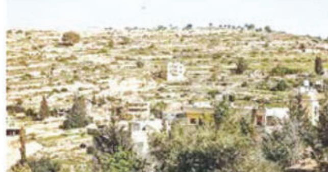
जो कानून और मौजूदा समझौतों का उल्लंघन है।' मंत्रालय ने बताया कि इजरायली सरकार ने स्थिति और सम्पत्ति कानून के तहत प्रशासनिक कदम को मंजूरी दी है। सऊदी अरब के विदेश मंत्रालय ने बयान में कहा कि यह कदम कब्जे वाले इलाके में एक नई कानूनी और प्रशासनिक हकीकत को

येरूशलम, एजेंसी। इजरायल सरकार ने पश्चिमी तट में जमीन पंजीकरण प्रक्रिया शुरू करने के हार्लिया फैसले की आठ मुस्लिम देशों द्वारा निंदा करने वाले संयुक्त बयान को बेवुनियाद और गुमराह करने वाला बताया है। मंगलवार को तुर्की, मिस्र, जॉर्डन, इंडोनेशिया, पाकिस्तान, कतर, सऊदी अरब और संयुक्त अरब अमीरात के विदेश मंत्रियों ने पश्चिमी तट में जमीन को सरकारी सम्पत्ति घोषित करने और उनके पंजीकरण और मालिकाना हक के सेटलमेंट के लिए प्रक्रिया को मंजूरी देने के इजरायली सरकार के फैसले की निंदा की। मंत्रालय ने आज एक बयान में कहा, 'यह बयान असल में बेवुनियाद और जानबूझकर गुमराह करने वाला है। फिलिस्तीनी अधिकारी ही क्षेत्र सी में गैर-कानूनी जमीन पंजीकरण प्रक्रिया को आगे बढ़ा रहे हैं,