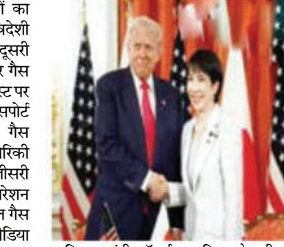
वाणिज्य मंत्री हॉवर्ड लुटनिक के बीच बैठक हुई थी, जहां पहले दौर के निवेश में तेजी लाने पर सहमति बनी। ये निवेश रणनीतिक क्षेत्रों जैसे क्रिटिकल मिनेरल्स, सेमीकंडक्टर, आर्टिफिशियल इंटेलिजेंस और ऊर्जा पर केंद्रित हैं, जो दोनों देशों की राष्ट्रीय सुरक्षा और आर्थिक हितों को मजबूत करेंगे।

डायमंड या अन्य महत्वपूर्ण खनिजों का उत्पादन होगा, जो अमेरिका की विदेशी निर्भरता कम करने में मदद करेगा। दूसरी परियोजना टेक्सास राज्य में तेल और गैस की सुविधाओं की है, जिसमें गल्फ कोस्ट पर एक डीपवॉटर क्रूड ऑयल एक्सपोर्ट सुविधा और लिक्विफाइड नेचुरल गैस (एलएनजी) प्रोजेक्ट शामिल हैं, जो अमेरिकी ऊर्जा निर्यात को बढ़ावा देंगे। तीसरी परियोजना ओहियो राज्य में पावर जेनरेशन प्लांट की है, जो एक बहुत बड़ा नेचुरल गैस पावर प्लांट होगा। ट्रंप ने सोशल मीडिया पोस्ट में कहा कि ये प्रोजेक्ट बहुत बड़े स्तर के हैं और इन्हें लागू करने में टैरिफ की अहम भूमिका रही है। उन्होंने इसे अमेरिका और जापान के लिए ऐतिहासिक समय बताया। उन्होंने कहा कि अमेरिका फिर से निर्माण कर रहा है, उत्पादन कर रहा है और जीत रहा है। पिछले हफ्ते वाशिंगटन में जापान के उद्योग मंत्री रयोसी अकाजावा और अमेरिकी