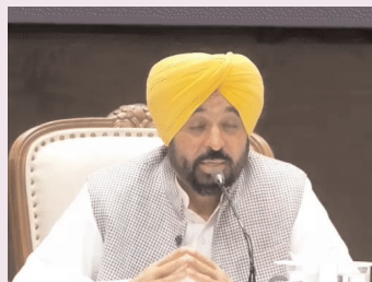
ये। मान ने कहा- पानी देने के लिए 1920 में ब्रिटिश राज में तत्कालीन वीकानेर महाराज

जयपुर/चंडीगढ़। पंजाब के मुख्यमंत्री भगवंत मान ने राजस्थान सरकार से पिछले छह दशकों के पानी का पैसा बकाया होने का दावा किया है। मान ने राजस्थान से 1.44 लाख करोड़ देने की मांग की है। इसके लिए औपचारिक दावा पेश करने की घोषणा की है। मान ने कहा- राजस्थान या तो पैसा दे या पंजाब से पानी लेना बंद करे। मान बुधवार को चंडीगढ़ में मीडिया से बातचीत कर रहे