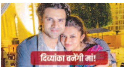
दिव्यांका बनेंगी मां!

साथ शेयर करते हैं। यही वजह है कि अब तक इस प्रेग्नेंसी की खबर को सीक्रेट रखा गया था। चाहे वेकेशन की तस्वीरें हों या एक-दूसरे को प्रोफेशनल लाइफ में सपोर्ट करना, 'दिवेक' ने हमेशा एक स्ट्रॉंग पार्टनरशिप की मिसाल पेश की है।