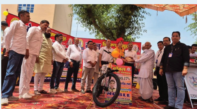
बुहाना में नोबल प्रतिभाओं का सम्मान करते हुए अतिथिगण