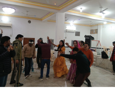
समापन होगा। उन्होंने बताया कि होली की ऐतिहासिक मस्ती लक्ष्मणगढ़ के कलाकारों