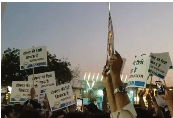
पेपर माफिया और NTA की मिलीभगत से टूटे युवाओं के सपने