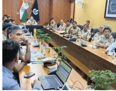
अधीक्षक अपने अधीनस्थ थानों का नियमित निरीक्षण करें और अनुसंधान की गुणवत्ता सुनिश्चित करें। साथ ही पुलिस लाइन्स का नियमित दौरा, मूलभूत सुविधाओं का आकलन, लाइब्रेरी स्थापना और पुलिस क्वार्टर्स की मरम्मत के लिए ठोस कार्ययोजना बनाने को कहा गया।