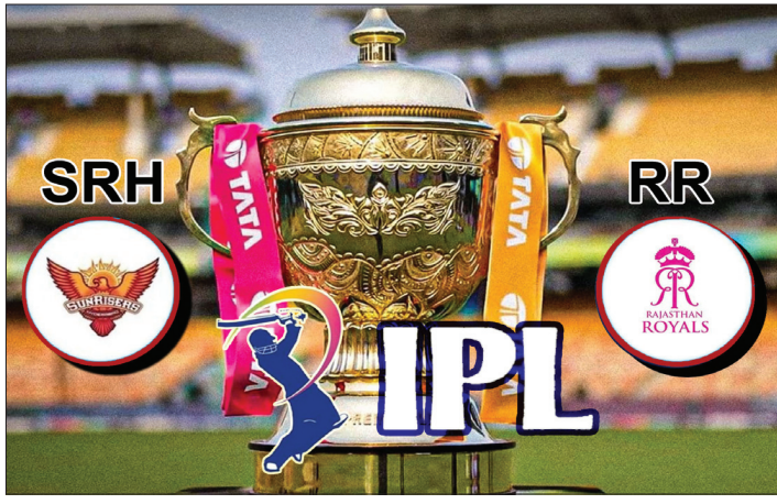
मुकाबले हुए हैं जिसमें से राजस्थान रॉयल्स ने 9 जबकि सनराइजर्स हैदराबाद ने 13 मैच जीते हैं।