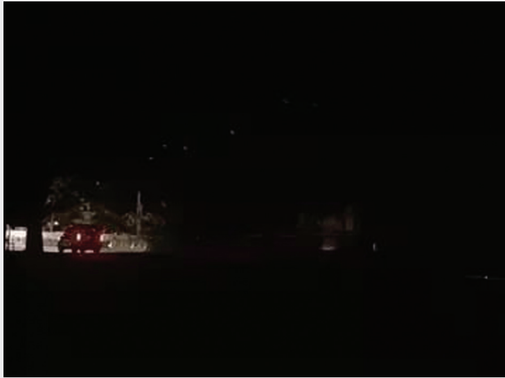
ब्लैकआउट कर आपातकालीन परिस्थितियों में शहर की तैयारी को परखा गया।

शहर में शुक्रवार रात ठीक 10 बजे अचानक ब्लैकआउट कर दिया गया, जिससे पूरे शहर में कुछ समय के लिए अंधेरा छा गया। जैसे ही घड़ी ने 10 बजाए, कलेक्टर परिसर, नेतराम मधराज कॉलेज और डाइट संस्थान में लगे नागरिक सुरक्षा के सायरन तेज आवाज के साथ गूँज उठे। सायरनों की आवाज ने पूरे इलाके को सतर्क कर दिया और लोगों को पहले से जारी निर्देशों के अनुसार तुरंत लाइटें बंद करने का संकेत मिला। इस दौरान रात 10 बजे से लेकर करीब 10:15 बजे तक पूरे शहर में बिजली आपूर्ति बंद रही। करीब 15 मिनट तक चले इस ब्लैकआउट के दौरान जिला प्रशासन, पुलिस विभाग और नागरिक सुरक्षा की टीमों पूरी तरह अलर्ट मोड पर सड़कों पर तैनात रहीं। हर गतिविधि पर नजर रखी गई और व्यवस्थाओं की बारीकी से मॉनिटरिंग की गई। दरअसल, यह पूरा आयोजन केंद्र सरकार के निर्देश पर आयोजित मॉकड्रिल का हिस्सा था, जिसमें दिन के समय विभिन्न विभागों के बीच तालमेल का अभ्यास किया गया और रात के समय