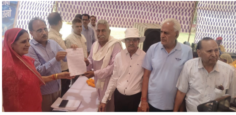
प्रभावित चल रही है। 14 अप्रैल 2026 के बाद हालात और बिगड़ गए हैं, जिससे प्रदेशभर के हजारों पेंशनर्स को गंभीर परेशानियों का सामना करना पड़ रहा है। ज्ञापन में कहा गया कि वृद्धावस्था में अधिकांश पेंशनर्स निर्यामित