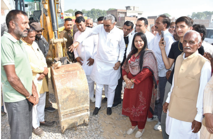
शुरुआत की। इस परियोजना को क्षेत्र की मूलभूत सुविधाओं को सुदृढ़ करने की दिशा में एक अहम कदम माना जा रहा है। लगभग 24 करोड़ रुपये की लागत से बनने वाली यह योजना हंस कॉलोनी, स्वामी नगर, आजाद नगर, कीर्ति कॉलोनी और हरनाम सिंह कॉलोनी सहित आसपास के क्षेत्रों के हजारों परिवारों को स्वच्छता, बेहतर स्वास्थ्य सुविधाओं और आधुनिक शहरी व्यवस्था से जोड़ेगी।