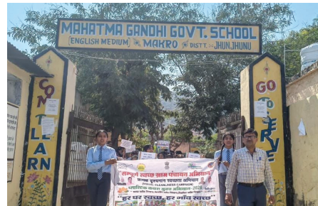
रूप में भेंट किया। यह प्रयास न केवल प्लास्टिक मुक्ति का संदेश देता है, बल्कि अपशिष्ट से उपयोगी वस्तु बनाने की प्रेरणा भी प्रदान करता है। कार्यक्रम का समापन ध्वजकला प्रतियोगिता के साथ हुआ, जिसमें बच्चों ने प्लास्टिक मुक्ति जीवन, स्वच्छ गांव और प्रकृति संरक्षण पर रचनात्मक चित्र बनाए। सभी प्रतिभागियों बच्चों को प्रोत्साहन पुरस्कार वितरित किए गए। यह अभियान स्थानीय स्तर पर पर्यावरण जागरूकता बढ़ाने तथा सामुदायिक भागीदारी को मजबूत करने में महत्वपूर्ण सिद्ध हुआ। ग्रामीणों में अपनाई गई यह पहल माकरो को जल्द ही प्लास्टिक मुक्ति गांव बनाने की दिशा में मजबूत कदम है।