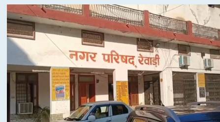
खुद चुकी है। अनाज मंडी और पुराने हाउसिंग बोर्ड की मुख्य सड़क पर बनाए जा रहे नाले में थर्ड क्लास ईटों के इस्तेमाल का वीडियो सोशल मीडिया पर वायरल हो चुका है। वीडियो में साफ देखा जा सकता है कि किस तरह नाले में घटिया ईटें लगाई जा रही हैं। जब एक राहगीर ने इस पर सवाल उठाया तो भ्रष्टाचार की परतें खुद-ब-खुद खुलती चली गईं। इतना ही नहीं, सच्चाई छुपाने के लिए आनन-फानन में नाले पर सीमेंट-मसाले की लिपाई कर दी गई, ताकि घटिया ईटें नजर न आए। जब ठेकेदार के कारिदे से सवाल किया गया तो उसने इसे 'गलती से साइट पर आ गई ईटें' बताकर पल्ला झाड़ लिया। सबसे बड़ा सवाल यह है कि यदि ईटें गलती से आई थीं, तो मरिांतरिण करने वाले जिम्मेदार अधिकारियों ने इन्हें तुरंत रिजेक्ट क्यों नहीं किया? आखिर किसके संरक्षण में यह सब चलता रहा?