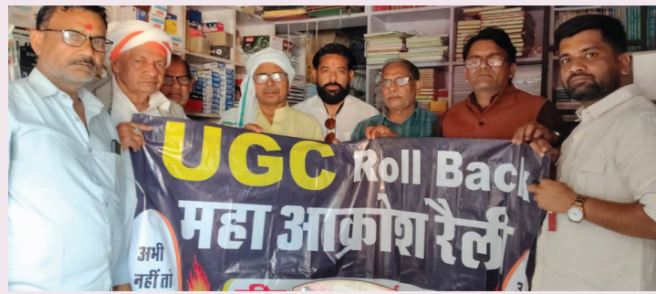
पदाधिकारी मौजूद रहे, जिन्होंने कहा कि यूजीसी के नियमों से युवाओं के भविष्य, शैक्षणिक अवसरों और रोजगार की संभावनाओं पर प्रतिकूल असर पड़ने की आशंका है, इसलिए यह विरोध केवल संगठन का नहीं बल्कि समाज और आने वाली पीढ़ी के हितों से जुड़ा सवाल है। बैठक के बाद सवर्ण समाज के कार्यकर्ताओं ने महवा नगर में जनसंपर्क कर