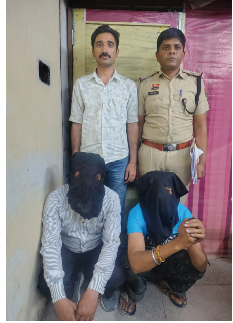
कार्रवाई करते हुए दोनों आरोपियों को गिरफ्तार कर लिया है और मामले की गहन जांच जारी है।