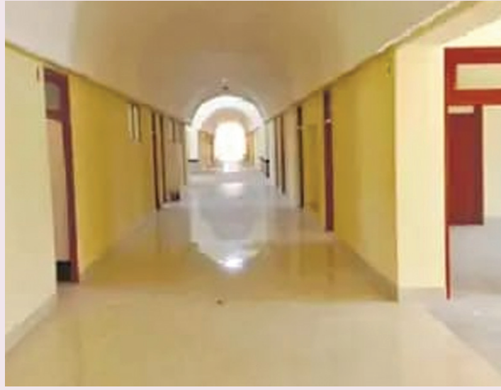
6 से शुरू की गई है और प्रत्येक कक्षा में 80-80 सीटें निर्धारित हैं। यहां सीबीएसई

प्रदेश में बेटियों की शिक्षा और सैन्य अनुशासन को बढ़ावा देने की दिशा में महत्वपूर्ण पहल करते हुए बीकानेर और सीकर में शुरू हो रहे बालिका सैनिक स्कूलों के लिए प्रथम चरण में 157 छात्राओं का चयन किया गया है। बीकानेर के जयमलसर स्थित रामी देवी रामनारायण राठी बालिका सैनिक स्कूल में 78 छात्राओं तथा सीकर के महाराव शेखा जी राजकीय बालिका सैनिक स्कूल में 79 छात्राओं को अंतिम रूप से चयनित किया गया है। चयनित छात्राओं को 30 अप्रैल तक संबंधित स्कूलों में अनिवार्य रूप से रिपोर्टिंग करनी होगी। यदि निर्धारित तिथि तक रिपोर्टिंग नहीं की जाती है तो प्रवेश स्वतः निरस्त कर दिया जाएगा और ऐसी स्थिति में वेटिंग सूची की छात्राओं को मौका दिया जाएगा। दोनों स्कूलों में प्रवेश प्रक्रिया कक्षा