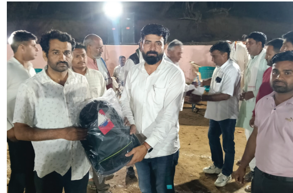
भीम प्रज्ञा न्यूज मंडी अटेली।