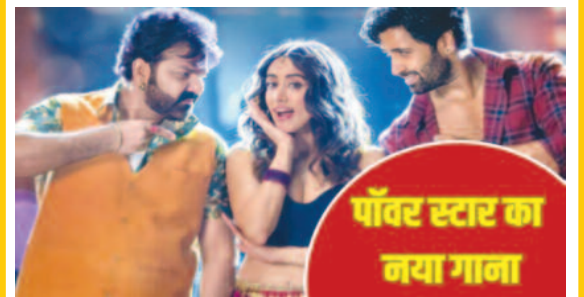
पॉवर स्टार का नया गाना

पवन सिंह का आ रहा एक और धमाकेदार गाना, गोरखपुर में इस दिन होगा लॉन्च