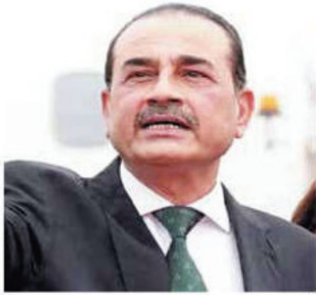
अपनी सैन्य कामयाबी दिखाना और अपने देश में अपनी पकड़ को और मजबूत करना था।

सीएनएन न्यूज 18 के अनुसार, टीटीपी की मैगजीन मुजल्ला तालिबान के 11वें अंक में मुनीर पर कई आरोप लगाए हैं। इसमें कहा गया है कि मुनीर ने अफगानिस्तान को भारत की तुलना में एक आसान निशाना समझा। मई 2025 में भारत के साथ हुए टकराव में हार और दुनिया भर में भारत के बढ़ते समर्थन को देखते हुए उन्होंने यह रास्ता चुना। दावा किया जा रहा है कि ऐसा करने के पीछे उनका मकसद