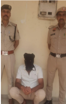
नियमानुसार कार्यवाही अमल में लाई जा रही है।