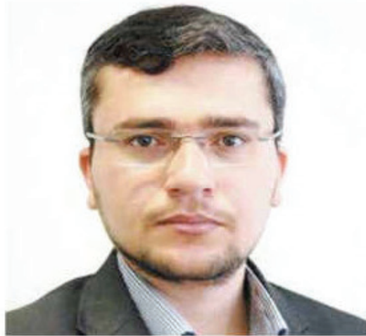
बातचीत के लिए सही मध्यस्थ नहीं है और उसमें मध्यस्थता के लिए जरूरी विश्वसनीयता नहीं है। वे हमेशा ट्रंप के फायदों का ध्यान रखते हैं और अमेरिकियों की मर्जी के खिलाफ एक शब्द भी नहीं कहते।

तेहरान, एजेंसी। ईरान और अमेरिका के मध्य तनाव कम करने के उद्देश्य से पाकिस्तान की मध्यस्थता में युद्धविराम (सीजफायर) को लेकर वार्ता धीरे-धीरे आगे बढ़ रही है। इस दीर्घकालिक गतिरोध को समाप्त करने के लिए पाकिस्तान ने स्वयं को एक मध्यस्थ के रूप में प्रस्तुत किया है। पाकिस्तान इस राजनयिक पहल के माध्यम से न केवल अपनी अंतरराष्ट्रीय छवि को सुधारने का प्रयास कर रहा है, बल्कि उसे इस प्रक्रिया के बदले आर्थिक सहयता मिलने की भी प्रबल संभावना है। हालांकि, इन प्रयासों के बीच ईरान के भीतर पाकिस्तान की भूमिका को लेकर विश्वसनीयता का संकट स्पष्ट रूप से दिखाई दे रहा है।