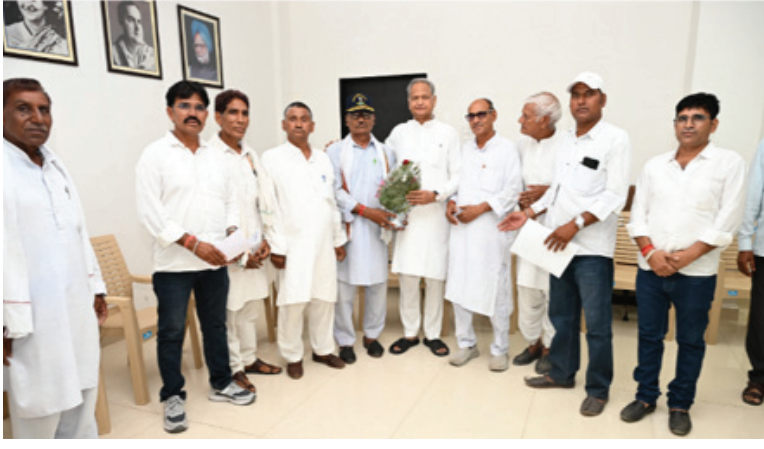
सुसाइड केस के संपूर्ण प्रकरण में पोस्ट मार्टम के दौरान प्रशासन, पुलिस प्रशासन द्वारा किए गए दुर्व्यवहार, प्रशासन को शामिल करते हुए निष्पक्ष