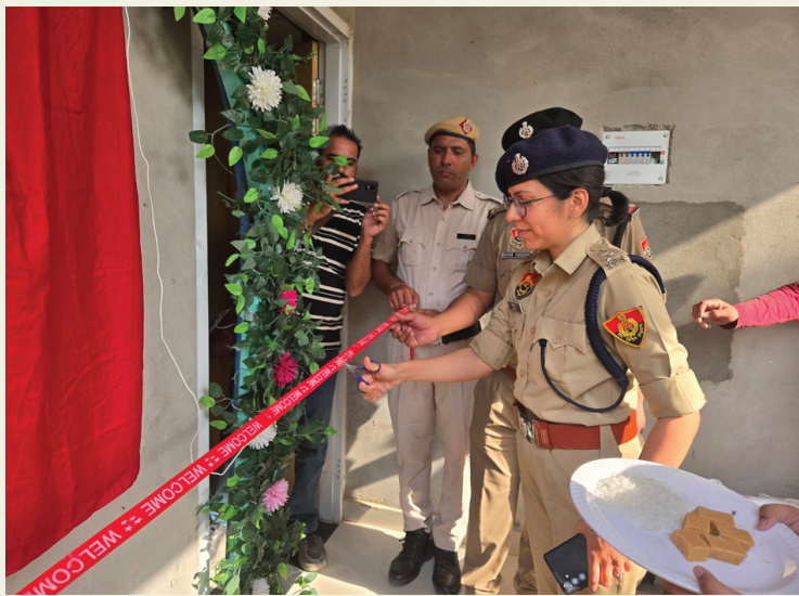
आमजन की शिकायतों के त्वरित समाधान में लगातार महत्वपूर्ण भूमिका निभाती रही है। नए

बेहतर सुविधाओं से सुसज्जित भवन से पुलिस कार्यप्रणाली होगी अधिक प्रभावी, आमजन को मिलेगी बेहतर पुलिस सेवाएं