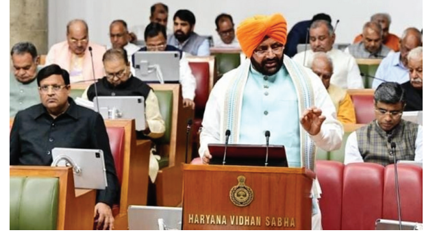
जाएंगे। नवनिर्मित जिला हांसी को आधुनिक सुविधाओं से युक्त मॉडल जिले के रूप में विकसित किया जाएगा। एआई मिशन के तहत एक लाख युवाओं को प्रशिक्षित किया जाएगा। इसके लिए चार विभागों से प्रस्ताव प्राप्त हुए हैं। हर 'स्वस्थ नारी योजना' के अंतर्गत प्रत्येक जिले में नारी क्लिनिक स्थापित किए जाएंगे। प्रदेश में 2000 नए बीटा बूथ खोले जाएंगे। वायु प्रदूषण से निपटने के लिए विश्व बैंक की सहायता से एयर क्लीन प्रोजेक्ट को मंजूरी दी गई है। वर्ष 2031 तक सभी जिलों में 2716 करोड़ रुपये की लागत से इस परियोजना पर कार्य होगा। ग्रीन हाइड्रोजन पॉलिसे लागू की जाएगी तथा 2.2 लाख घरों की छतों पर सफ्टटॉप सोलर लगाने का प्रस्ताव है, जिससे सौर ऊर्जा को बढ़ावा मिलेगा। महाग्राम योजना के तहत शहरी क्षेत्रों में 150 किलोमीटर लंबी सीवरेज लाइन बिछाई जाएगी। वाटर सिवियर योजना के अंतर्गत 116 नहरों

सीएम सैनी ने बताया कि हरियाणा की आर्थिक स्थिति लगातार मजबूत हो रही है। वर्ष 2024-25 के त्वरित अनुमान के अनुसार प्रदेश की प्रति व्यक्ति आय 3,58,171 रुपये तक पहुंच गई है, जो प्रमुख राज्यों में सबसे अधिक है। प्रदेश में किसानों के लिए 'एग्री डिस्कॉम' नाम से नया बिजली निगम बनाया जाएगा, जिसके माध्यम से ट्यूबवेल कनेक्शन उपलब्ध कराए