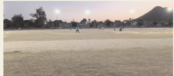
खेतड़ी नगर के नेहरू मैदान में रविवार को रात दृश्या रोशनी में क्रिकेट प्रतियोगिता का रोचक मुकाबला

खेतड़ी नगर के नेहरू मैदान में आयोजित विवेकानंद इंटर डिपार्टमेंट क्रिकेट टूर्नामेंट अब अपने अंतिम चरण में पहुंच गया है। सोमवार को खेले जाने वाले फाइनल मुकाबले में पत्रकार संघ और पंचायती राज विभाग की टीम आमने-सामने होंगी। 23 मार्च से शुरू हुई इस डे-नाइट क्रिकेट प्रतियोगिता में उपखंड क्षेत्र के विभिन्न विभागों की कुल 16 टीमों ने हिस्सा लिया।