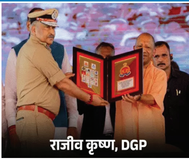
राजीव कृष्ण, DGP

राजीव कृष्ण 1991 बैच के आईपीएस अधिकारी हैं। मूलरूप से नोएडा के रहने वाले राजीव कृष्ण का जन्म 26 जून, 1969 को हुआ था। राजीव कृष्ण ऐसे घराने से संबंध रखते हैं, जहां एक दो नहीं