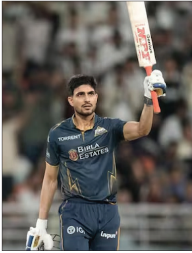
2023 सीजन में मुंबई इंडियंस के खिलाफ 129 रन की पारी के दौरान 49 गेंदों में बनाया था। शुभमन से पहले,

इस मैच में 215 रन के विशाल लक्ष्य का पीछा करते हुए गिल ने यह मैच विजेता पारी खेली, जिसने गुजरात फाइनल में पहुंची। इस मुकाबले में शुभमन ने 53 गेंदों में 104 रन बनाये। इसमें 15 शानदार चौके और तीन छक्के शामिल थे। यह आईपीएल में शुभमन का कुल पांचवां शतक है, जबकि कप्तान के तौर पर इस लीग में यह उनका दूसरा शतक है। इस दौरान उनकी और साई सुदर्शन के बीच हुई पहले विकेट के लिए 160 रन की साझेदारी हुई। इस शतक के साथ ही शुभमन आईपीएल प्लेऑफ के इतिहास में सबसे तेज शतक लगाने वाले खिलाड़ी बन गये। इस प्रकार उन्होंने अपना ही पिछला रिकॉर्ड तोड़ा, जो उन्होंने