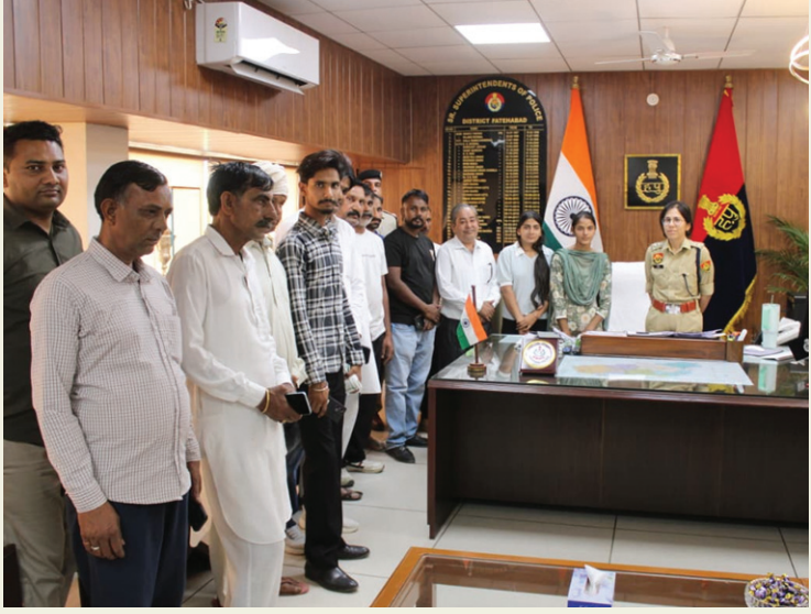
आईएमईआई आधारित ट्रेसिंग, लोकेशन विश्लेषण तथा डिजिटल सर्विलांस के माध्यम