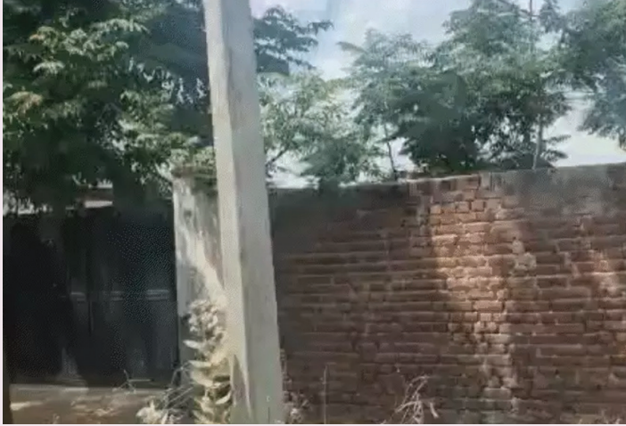
बिना ट्रेनिंग बंट रहे सर्टिफिकेट

भीम प्रज्ञा न्यूज झुंझुनू । झुंझुनू में एक ऐसा गिरोह सक्रिय है जो हरियाणा के लोगों को रातों-रात यहां का किराएदार बना देता है और फिर परिवहन विभाग से उनके हैवी लाइसेंस जारी करवा देता है। उप पंजीयक कार्यालय में इन फर्जी किरायानामों का रजिस्ट्रेशन किया जा रहा है। परिवहन अधिकारी बिना जांच-पड़ताल किए हरियाणा के लोगों को इसी रजिस्टर्ड किरायानामे के आधार पर हैवी लाइसेंस बनाकर दे रहे हैं। ये सभी लोग हरियाणा के हैं। इनका झुंझुनू में न कोई व्यापार है और न ही नौकरी। फिर भी इन्हें किराएदार बना झुंझुनू में रहना दिखा दिया। यह सब फर्जीवाड़ा हैवी ड्राइविंग लाइसेंस के लिए किया जा रहा है। पड़ताल में सामने आया है कि हरियाणा में हैवी ड्राइविंग लाइसेंस के कड़े नियमों से बचने के लिए वहां के लोग झुंझुनू में फर्जीवाड़ा कर लाइसेंस बनवा रहे हैं। इस किरायानामे में 40 लोगों को खाली खेत में किराएदार दिखा दिया। वजह यह सामने आई कि हरियाणा में हैवी लाइसेंस के लिए नियम सख्त हैं। ऐसे में यहां आकर ड्राइवर अपना पता बदल कर लाइसेंस बनवा रहे हैं।