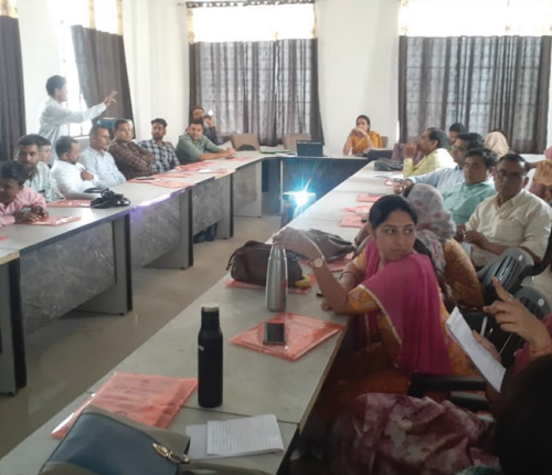
आमजन से अपील की है कि वे समय रहते सही और पूरी जानकारी भरें, जिससे डेटा अधिक सटीक और पारदर्शी बन सके। वहीं, दूसरे चरण की शुरुआत 16 मई से होगी, जिसमें जनगणना की टीमों घर-घर जाकर जानकारी एकत्रित करेंगी। इस कार्य के लिए मंडावा तहसील