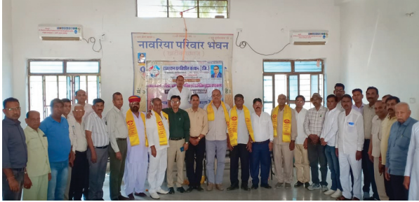
सामाजिक एकता और विकास पर जोर