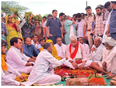
भूमि पूजन करते कृषि मंत्री।