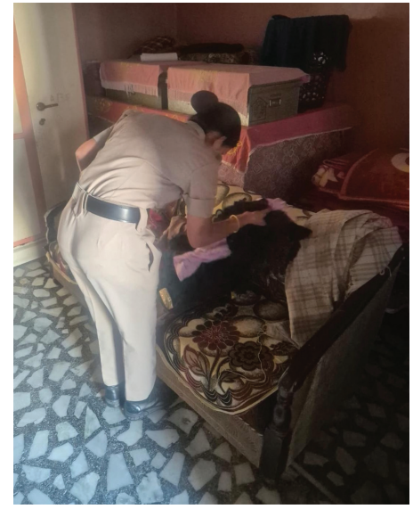
अपील की। साथ ही आमजन से यह भी आग्रह किया गया कि नशा तस्करी से संबंधित किसी भी सूचना को तुरंत पुलिस के साथ साझा करें। जिला पुलिस द्वारा इस प्रकार के अभियान आगे भी निरंतर जारी रखे जाएंगे, ताकि नशा मुक्त समाज के लक्ष्य को साकार किया जा सके।