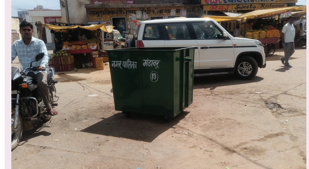
शहर के गाँधी चौक पर रखवाया गया कचरा संग्रहण पात्र।

मंडावर में 50 कचरा पात्र आये, 30 स्थानों पर रखवाने से बदली शहर की सूरत।