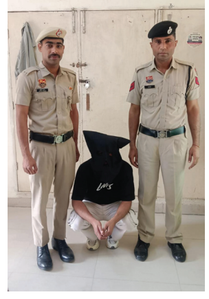
में प्लास्टिक कट्टा लेकर आता दिखाई