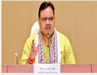
भीम प्रज्ञा न्यूज

जयपुर । मुख्यमंत्री भजलाल शर्मा ने कहा कि राजस्थान को हरियाली राजस्थान बनाना राज्य सरकार का प्रमुख लक्ष्य है। मानसून सीजन में 10 करोड़ पौधरोपण किया जाएगा। उन्होंने वन एवं पर्यावरण अधिकारियों को विस्तृत कार्ययोजना