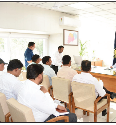
उपलब्ध करवाई जाए। साथ ही, गेंहू के अवशेष जलाने के मामलों में नियमों के तहत तुरंत कार्रवाई सुनिश्चित की जाए ताकि ऐसी घटनाओं पर प्रभावी अंकुश लगाया जा सके। डीसी ने कहा कि जिला प्रशासन का उद्देश्य किसानों को सहयोग देकर पर्यावरण संरक्षण सुनिश्चित करना है। सभी अधिकारी अपने-अपने स्तर पर जिम्मेदारी निभाते हुए इस अभियान को सफल बनाएं, ताकि जिले में स्वच्छ व प्रदूषण मुक्त वातावरण कायम रखा