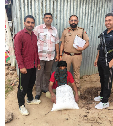
पर निगरानी शुरू की। इसी दौरान एक युवक हाथ