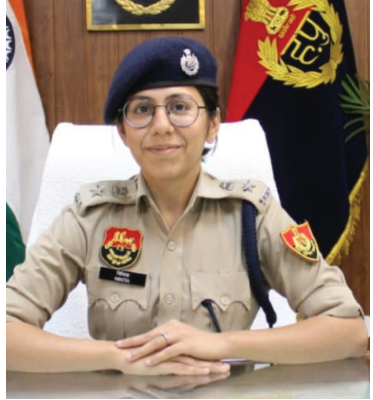
है कि जब भी वे अपने घर या दुकान को बंद कर बाहर जाने की योजना बनाएं—चाहे कुछ घंटों के लिए, एक दिन के लिए या लंबे समय के लिए—तो इसकी सूचना तुरंत अपने नजदीकी पुलिस थाना अथवा डायल 112 पर अवश्य दें। सूचना देते समय नागरिक अपने बाहर