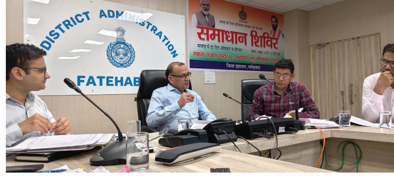
प्रकरण को नियमित मॉनिटरिंग सुनिश्चित की जाए। डीसी ने कोर्ट फाइल की रिकवरी, स्टाम्प एक्ट के तहत लंबित मामलों तथा द्यूबवेल जनगणना जैसे कार्यों में तेजी लाने के निर्देश दिए। साथ ही पंचायत भूमि पर अतिक्रमण हटाने तथा सरकारी भूमि से संबंधित मामलों में सख्त कार्रवाई करने को कहा, ताकि सरकारी संपत्तियों की सुरक्षा