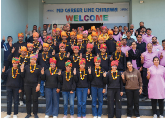
को प्रमाणित किया।