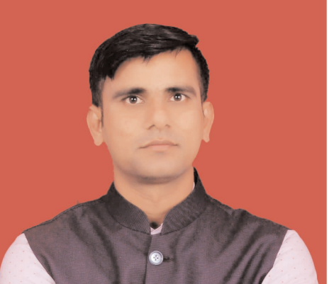
लेखक - मदन मोहन भास्कर